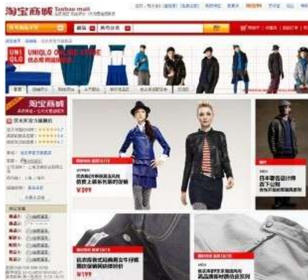
优衣库淘宝旗舰店

但当企业发展到一定阶段，就要根据建设自己独立的电子商城。据悉，服装行业老牌劲旅雅戈尔、报喜鸟相继建立了 B2C 电子商城，美特斯邦威也计划构建 B2C 网络渠道。而佐丹奴在 2007 年就建立了电子商城，并依靠对 ERP、CRM 和其它供应链环节的全面整合，共享实体门店仓储的策略，当年的销售额就突破了 4000 万元。