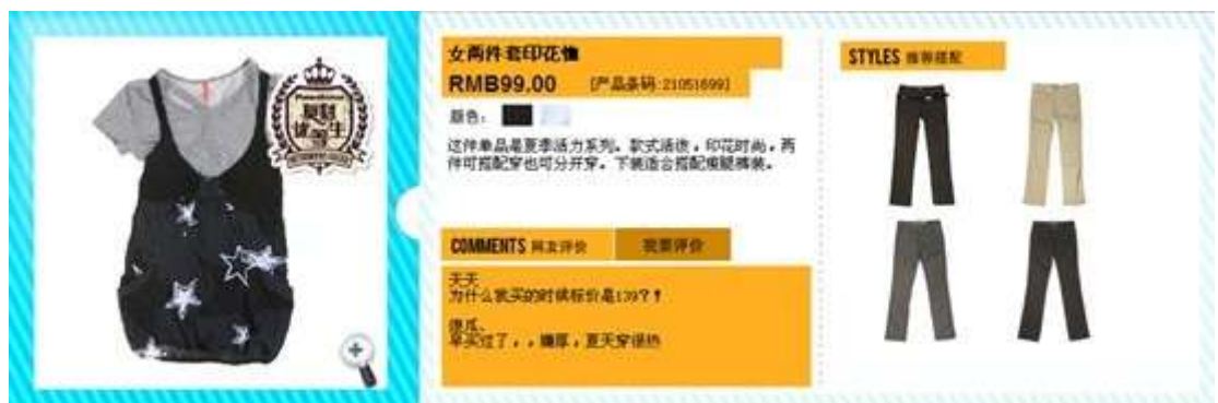
美特斯邦威产品展示（2）

而在佐丹奴的官网，浏览者还可以通过网页上的放大镜功清晰地看到了产品的面料、质地，并且能通过试穿功能感受到服装的款式，更能对产品进行评价，了解相似的款式、搭配技巧、相关活动、实体店铺地址.....这就在无形之中形成了购买驱动，将访客转化为顾客，将流量转化为订单。