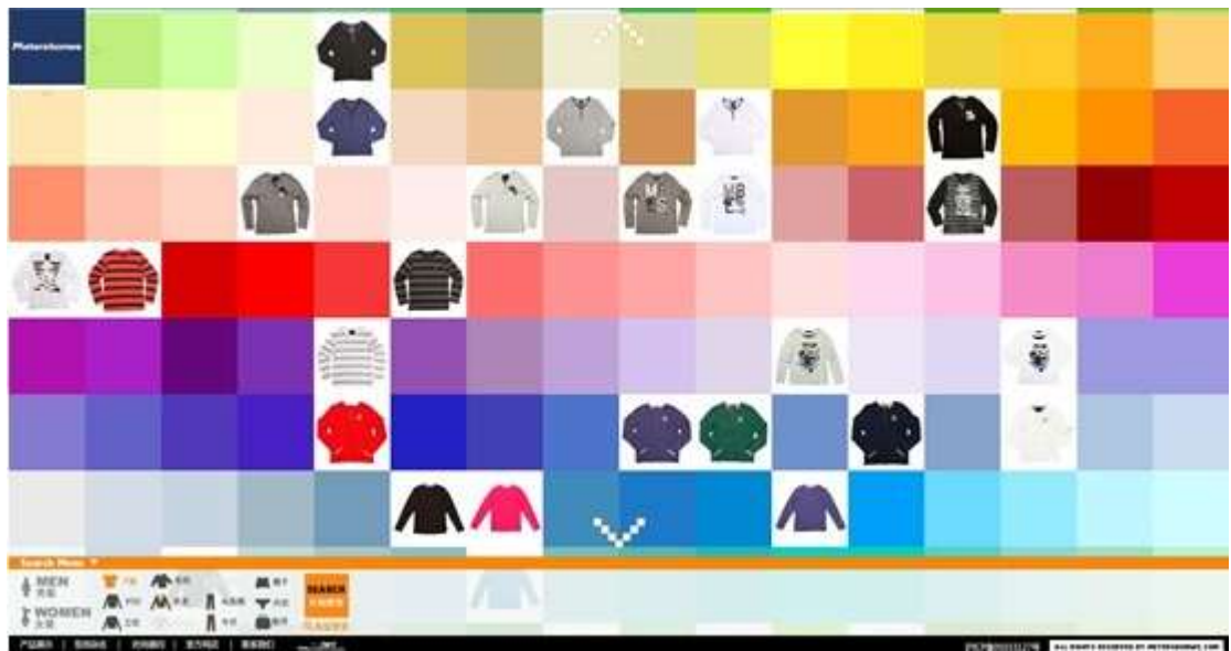
美特斯邦威产品展示（1）